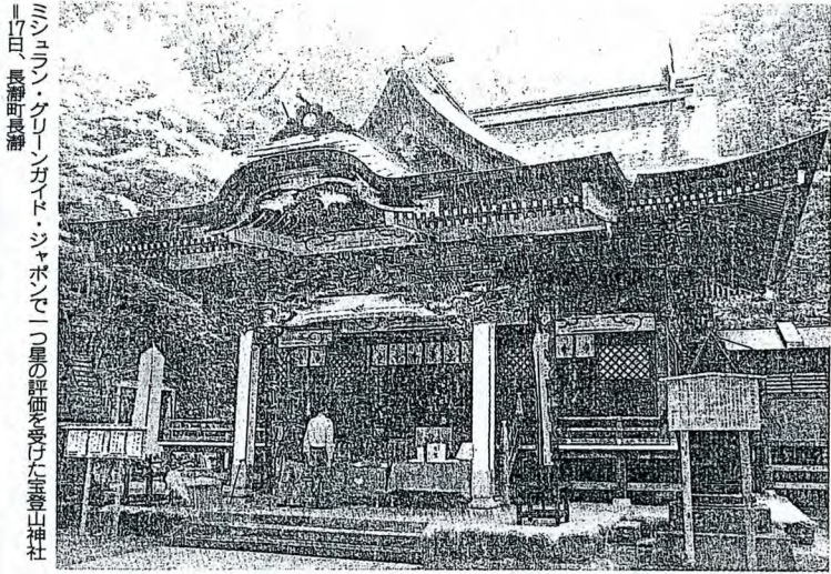
17日、長瀬町長瀬 ミシュラン・グリーンガイド・ジャポンで二つ星の評価を受けた泰山神社

星の数による「格付け」で知られるフランスのミシュラン社から発売された日本に関する旅行ガイドブック「ミシュラン・グリーンガイド・ジャポン」(フランス語版、672頁)で、世界遺産の熊野古道などとともに、長瀬町が取り上げられた。世界的に知られるミシュランの旅行ガイドブックに埼玉県の観光が紹介されたのは初めて(砂生敏一) 世界のホテルやレストランの格付けで知られるミシュラン。同社によれば、今回制作されたガイドブックは2009年に発売した初版の改訂版。内容を見直すとともに新たに約100カ所の観光地を掲載した。ページ数は初版から216ページ増えた。 埼玉県の章として、長瀬町の自然や県立自然の博物館、宝登山神社を紹介。「県立自然の博物館には、割製が展示されており、触ることが出来る。川(荒川)沿いを散歩したり、宝登山周辺ではサイクリングを楽しむの 改訂版制作担当者ス人の編集者12人が09年11月にかけて日本を巡った。掲載地は「お勧め度」として星(1から3)に分れる。三つ星は旅行する価値がある一、二つ星は「奇の道す」を表している。宝登山神社が一